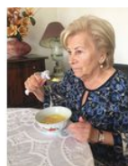
- Cuillère à soupe - 813077