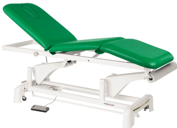
Table 3 plans Ecopostural